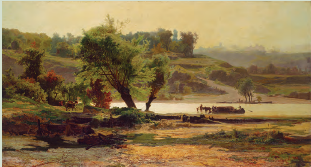
Luigi Chialiva, Paesaggio fluviale , ca. 1865/68 Lugano, MASI Museo d'arte della Svizzera italiana, Collezione Cantone Ticino, Donazione Fondazione Ing. Pasquale Lucchini