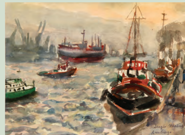
Sergio Maina, Amburgo, Il porto , 1965 Caslano, Museo Sergio Maina