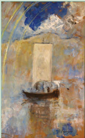
Filippo Franzoni, Arcobaleno sul lago , 1895/1900 Morcote, Galleria Poma