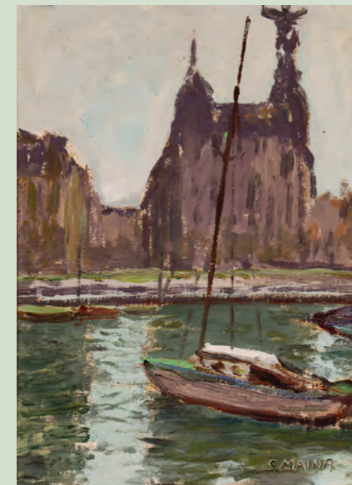
Sergio Maina, Poesia sul lago , Parigi 1935 Caslano, Museo Sergio Maina