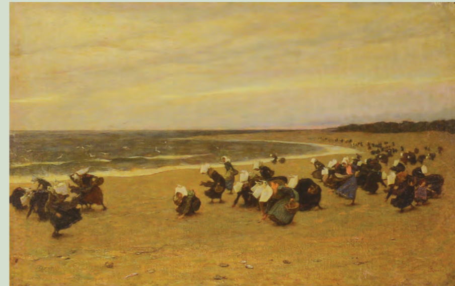
Luigi Rossi, La raccolta delle ostriche , ca. 1905/1910 Rancate, Pinacoteca cantonale Giovanni Züst