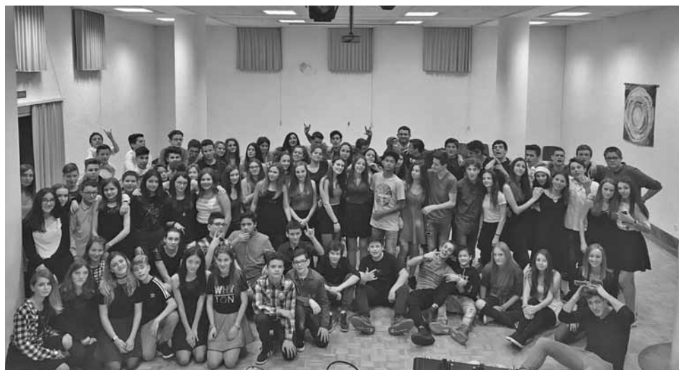
Venerdì 14 dicembre: festa per gli scolari delle superiori in centro parrocchiale