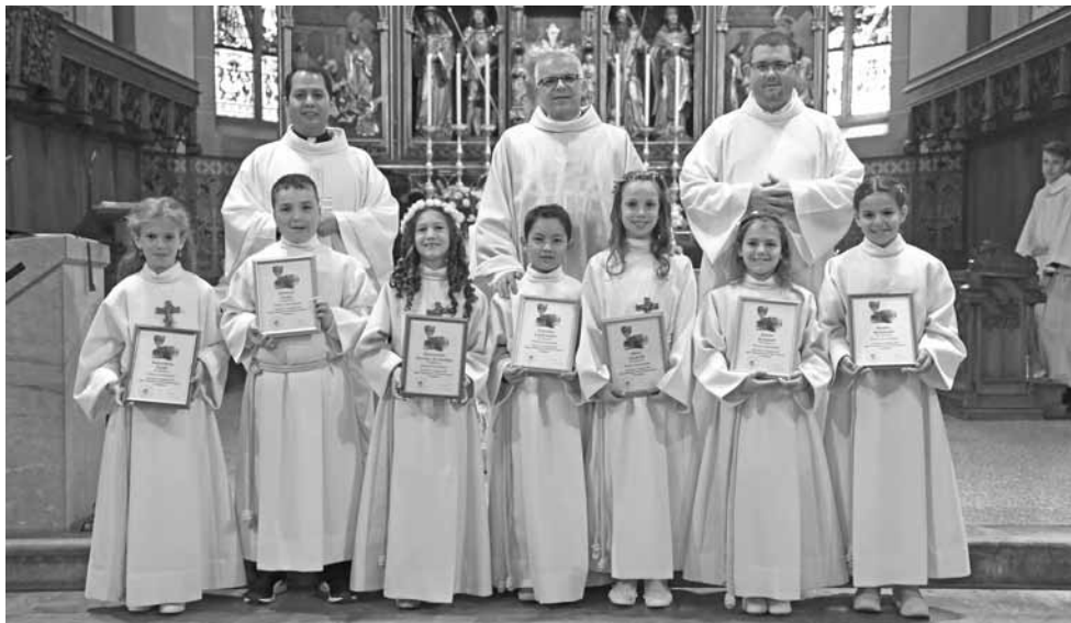
Domenica 6 maggio: celebrazione della Prima Comunione