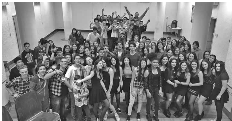
Sopra: serata con i giovani in centro parrocchiale (venerdì 15 dicembre) Sotto: alcuni dei ministranti presenti all'incontro di sabato 16 dicembre

10.00 S. Messa 17.30 a Cologna : S. Messa