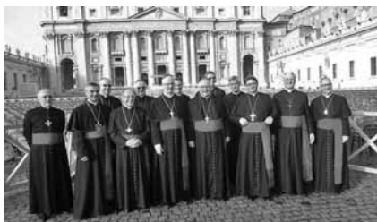
I Vescovi svizzeri in piazza San Pietro e attorno a papa Francesco

Assicurandovi della mia preghiera per voi, per i vostri sacerdoti e per i vostri diocesani, vi auguro di coltivare con zelo e pazienza il campo di Dio, conservando la passione della verità, e vi incoraggio ad andare avanti tutti insieme. Affidando il futuro dell'evangelizzazione nel vostro Paese alla Vergine Maria e all'intercessione di San Nicola di Flüe, di San Maurizio e dei suoi compagni, vi imparto di tutto cuore la Benedizione apostolica; e fraternamente vi chiedo di non dimenticarvi di pregare per me.